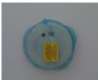
Afbeelding van rookmelder, nog voorzien van een afdekhoesje

De rookmelder is voorzien van een blauw hoesje. Deze zorgt ervoor dat er tijdens de bouw geen stof in het apparaat komt. Dit hoesje dient u te verwijderen wanneer u klaar bent met de woninginrichting (wanneer de woning stofvrij is).