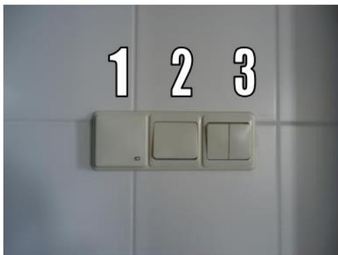
Schakelaars in badkamer

In uw badkamer bevindt zich een pulsschakelaar naast de schakelaars voor de verlichting. Deze schakelaar kunt u kort indrukken waarna de WTW-unit ongeveer 20 minuten in de hoge stand wordt geschakeld.