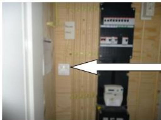
Bedieningsknop in meterkast