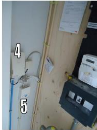
Meterkast in de woning