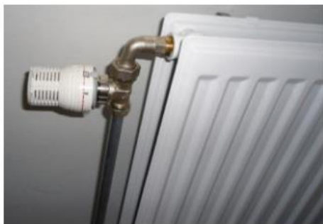
Thermostaatkraan: reageert niet via de kamerthermostaat

Doordat de radiatoren op de verdieping zijn voorzien van thermostatische radiatorcransen kan bijvoorbeeld de slaapkamer worden verwarmd terwijl de verwarming op de begane grond is uitgeschakeld.