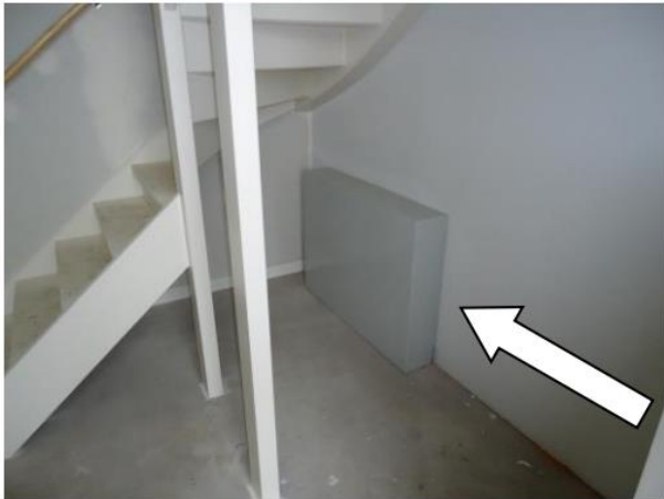
Afgedekte vloerverdeler op de beganegrond

De warmte door de vloerverwarming wordt geregeld via de vloerverdelers in de techniekruimte en op de beganegrond. De verdeler op de beganegrond is afgedekt met een stalen kap. Deze moet altijd bereikbaar blijven.