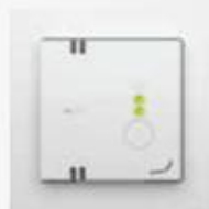
Stand 2 (midden)