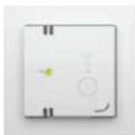
Automatisch CO 2 gestuurd

U kunt de ventilatie handmatig bedienen door de sensor op stand 1 (laag), stand 2 (midden) of stand 3 (hoog) in te stellen. Druk op de sensor totdat de juiste stand is ingesteld.