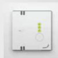
Stand 3 (hoog)