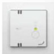
Stand 1 (laag)