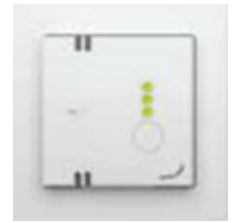
Stand 3 (hoog)