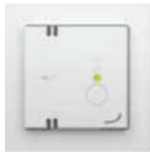
Stand 1 (laag)