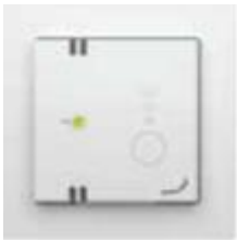
Automatisch CO2 Gestuurd

U kunt de ventilatie handmatig bedienen door de sensor op stand 1 (laag), stand 2 (midden), of stand 3 (hoog) in te stellen. Druk op de sensor tot de juiste stand is ingesteld.