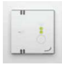
Stand 2 (midden)