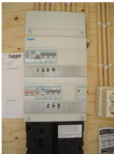
Groepenkast: in totaal 7 groepen verdeeld over 2 aardlekschakelaars