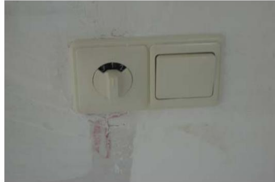
3 standenschakelaar (links )

De woningen met huisnummer 1 t/m 8 hebben een afzuigkap met motor die rechtstreek door het dak naar buiten gaat.