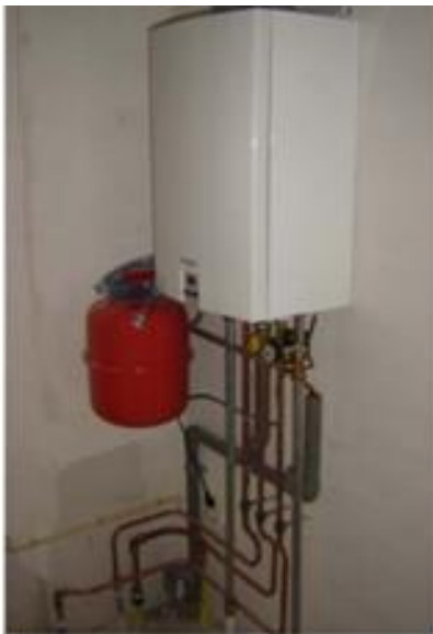
HR-combiketel. Het rode vat is een expansievat.

Uw huis heeft een centrale verwarming. Dit betekent dat één centrale ketel het hele huis verwarmt. Op deze ketel zijn leidingen aangesloten die naar de radiatoren lopen. Door de leidingen stroomt water dat door de ketel wordt opgewarmd. De radiator geeft de warmte vervolgens af aan de kamers. Het afgekoelde water stroomt terug naar de ketel en wordt weer opgewarmd. De temperatuur in de woonkamer kunt u regelen d.m.v. een handbedienbare kamerthermostaat. De temperatuur in de andere kamers in huis regelt u met de thermostaatknoppen op de radiatoren. Met centrale verwarming kunt u uw hele huis behaaglijk warm stoken.