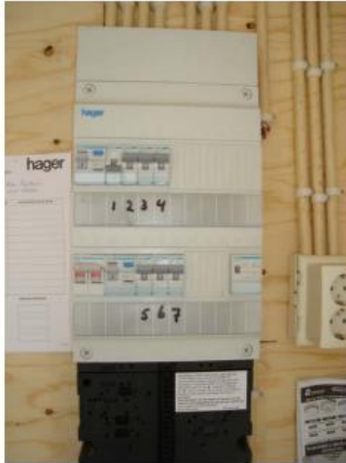
Groepenkast: in totaal 7 groepen verdeeld Over 2 aardelekschakelaars