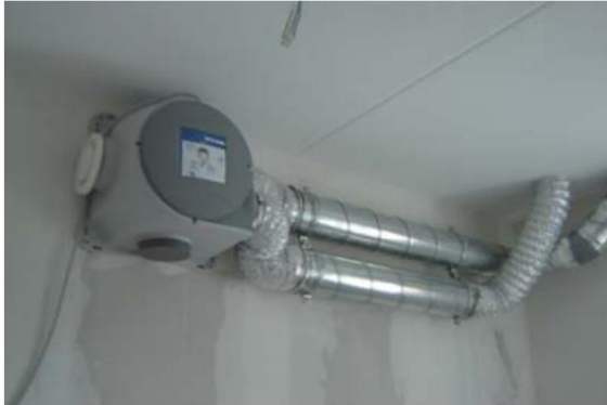
Mechanische ventilatie unit

Alle woningen zijn voorzien van een mechanisch afzuigsysteem in de volgende ruimten: keuken, toilet en de badkamer. Deze wordt bediend door een 3 standenschakelaar die los wordt bijgeleverd (afstandbediening) en door u te plaatsen is waar u wilt. Advies is badkamer.