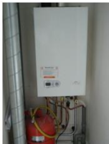
Fig.: 5.1.1. Rechtsboven de centrale verwarming. Linksboven de boiler.

Voor een goede werking moet de ruimte rond de radiator vrij zijn. U kunt dus beter geen meubels voor de radiator plaatsen of lange gordijnen voor de radiator hangen.