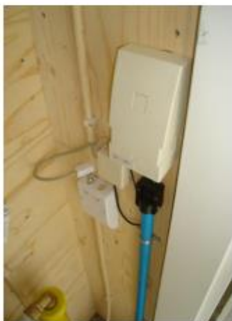
Fig.: 3.6.3 Rechtsboven de aansluiting van KPN Linksonder de aansluiting van UPC