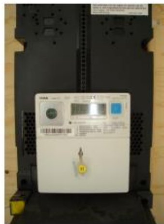
Fig.: 3.6.4 Digitale weergave elektriciteitsverbruik