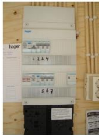
Fig.: 3.6.2 De zeven verschillende groepen.