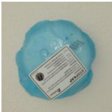
Fig.: 4.1.1 De rookmelder is voorzien van een blauw hoesje.

Indien de rookmelder per ongeluk afgaat, dient u het knopje van de melder in te drukken. Ook wanneer de batterij straks bijna leeg is, geeft het een piepsignaal. U dient dan de batterij zelf te vervangen.