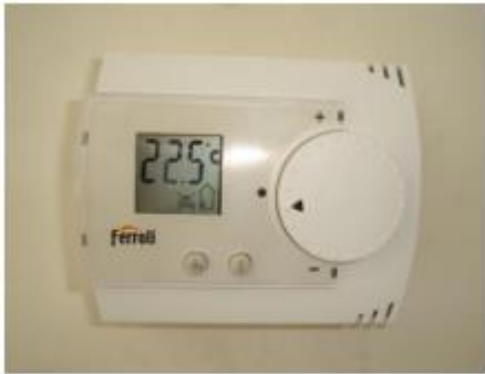
Fig.: 5.3.1. De Thermostaat.

Tijdens het douchen kunt u een besmetting oplopen, doordat u met de waterdamp bacteriën inademt. Laat daarom na de vakantie de douche een paar minuten op de heetste stand doorlopen, terwijl u volop ventileert. Zet dus het badkamerraam wijdopen of zet de mechanische ventilatie aan.