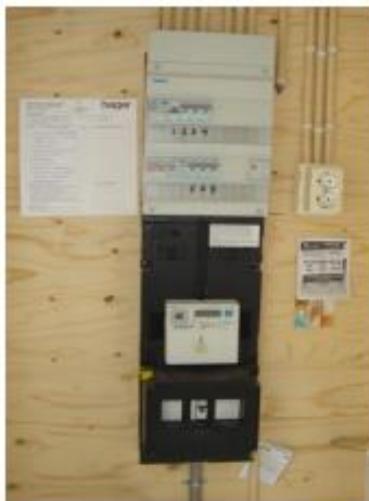
Fig.: 3.6.1 De meterkast

De aardlekschakelaar is een beveiliging tegen storingen in de stroomvoorziening. Bij storing schakelt deze schakelaar de stroom automatisch uit. Test de aardlekschakelaar tenminste één keer per maand. Als u de testknop "T" indrukt moet de schakelaar de elektriciteitsvoorziening uitschakelen. Wanneer dit niet gebeurt, dient u contact op te nemen met Wonion.