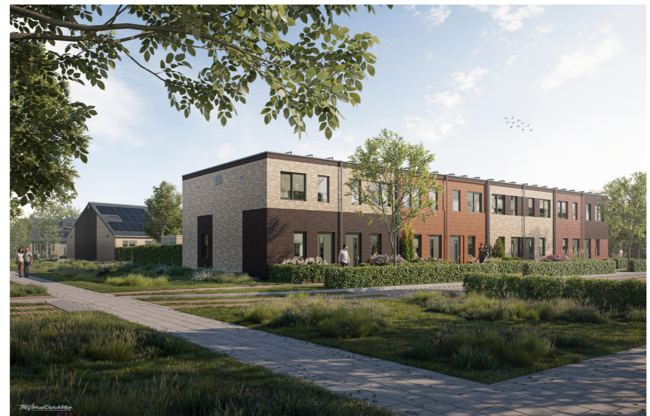
Artist Impression kleine gezinswoningen

Naast de 8 kleine gezinswoningen realiseerde Wonion ook 8 levensloopbestendige woningen op het terrein. Deze worden gerealiseerd aan de zijde van het Patrijsplein en hebben ook een duurzaam karakter. Naar verwachting is de oplevering van de woningen in oktober 2023, de woningen inmiddels verhuurd.