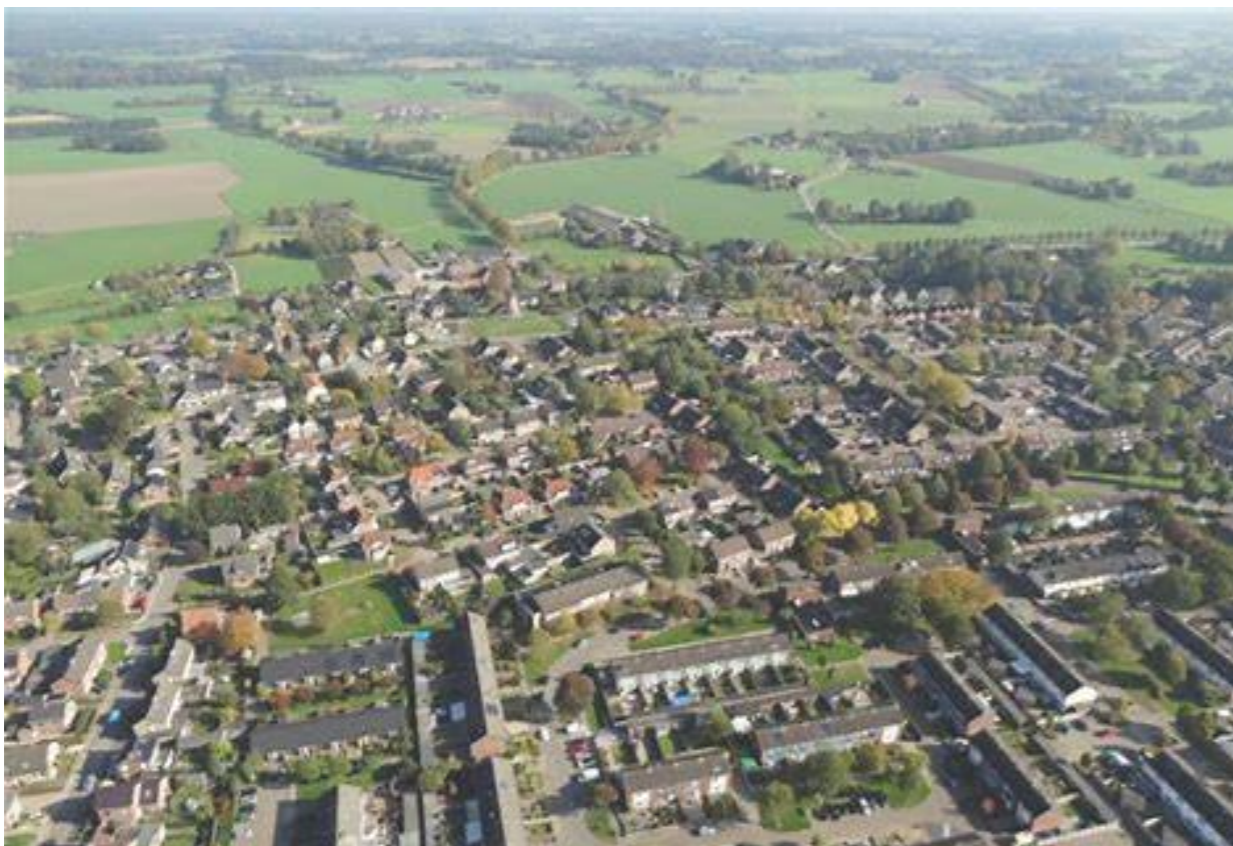
Silvolde vanuit vogelvluchtperspectief

Silvolde ligt in een prachtige, natuurlijke omgeving. Het dorp ligt aan de Oude IJssel en kent mooie wandelroutes. Sinds de ijstijd ligt aan de rand van Silvolde een bijzondere beboste heuvel, genaamd de Paasberg.